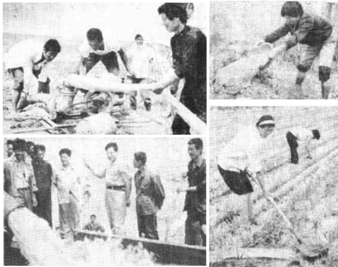
前一段时间,我市各级党政领导和广大人民群众,集中精力投入抗旱斗争,集中展示的是部分县区抗旱斗争的部分场面。 左:东营区领导亲临抗旱前线,指导农民合理用水,把有限的水用在最需要的地方。右:能利用的水,一滴也不浪费——牛庄镇抗旱前线一景。右下:广饶县井灌区充分发挥地下水优势,昼夜奋战,拖浇抢种,力争不误夏播。(本报记者徐兆鹏 摄影报道)

今年4月,该镇又制定了《大王镇高新技术产业密集区实施方案》,到“八五”末,认定高新技术企业11家,开发新技术产品50项,仅密集区总产值达到10亿元。(李军章 赵军元)